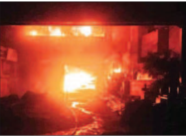
భారీగా ఎగిసిపడిన మంటలు