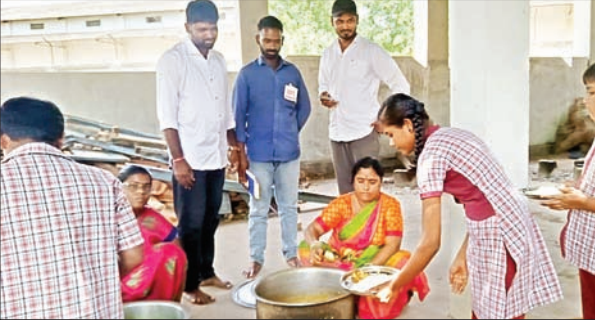
బీబీనగర్, జూలై 11